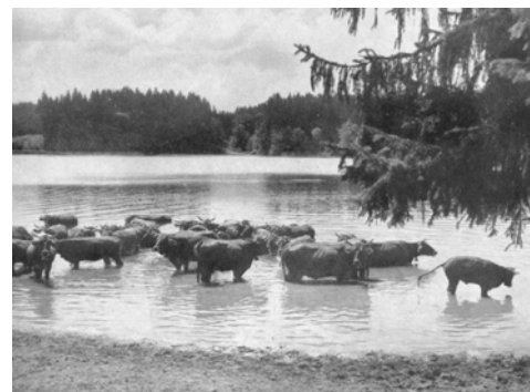
Allgäuer Kühe beim Baden