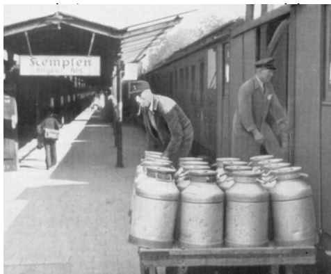
Allgäuer „Milch-Express“ im Hauptbahnhof Kempten

Die nachfolgenden Abbildungen sind nur eine kleine Auswahl des umfangreichen Repertoires.