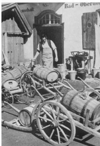
Vor der Dorfsennerei